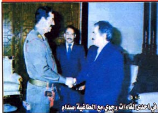
في إحدى لقاءات رجوي مع الطليعية صدام

الاساتية، وعلى وسائل الاعلام دون توقف، وكان لي عدة لقاءات مع المسؤولين الكنديين لغرض نفسه، وهم مهتمون بهذه القضية، لان هناك العشرات من العوائل ذات الاصول الايرانية تبحث عن اولادها المفرر بهم، وتطالب الحكومة الكندية والرأي العام للضغط على منظمة خلق من اجل تحقيق لقاءات بين المفرر بهم وتوابعهم، وترك الحرية لهؤلاء المفرر بهم حتى وان تمت دون العودة لعوائلهم، ذلك ان هذه المنظمة غير مرتاحة لجهود سراح ابنانها، وما طرح بوسائل الاعلام من فضائح عنها، وتتعامل مع الموضوع وكأنه عناد مع هذه العوائل.